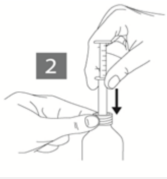
Figure 2 : Introduire la pipette dans le flacon.