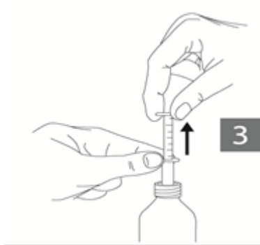
Figure 3 : En tenant la bague inférieure de la pipette, ajuster la bague supérieure au niveau correspondant au nombre de millilitres ou milligrammes dont vous avez besoin.