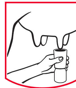
Teat Dip Bain de trayon

a-(p-Nonylphényle) omega-hydroxypoly (oxyéthylène) - iode .....1.70% p/p