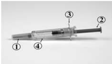
Seringue APRÈS L'UTILISATION