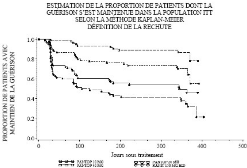
Figure 2 – Courbe de l'analyse de Kaplan-Meier; 3001A1-303-US