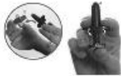
Figure 1A Figure 1B

N'enfoncez pas le piston tant que vous n'avez pas placé l'embout dans la narine. Sinon, vous perdrez la dose.